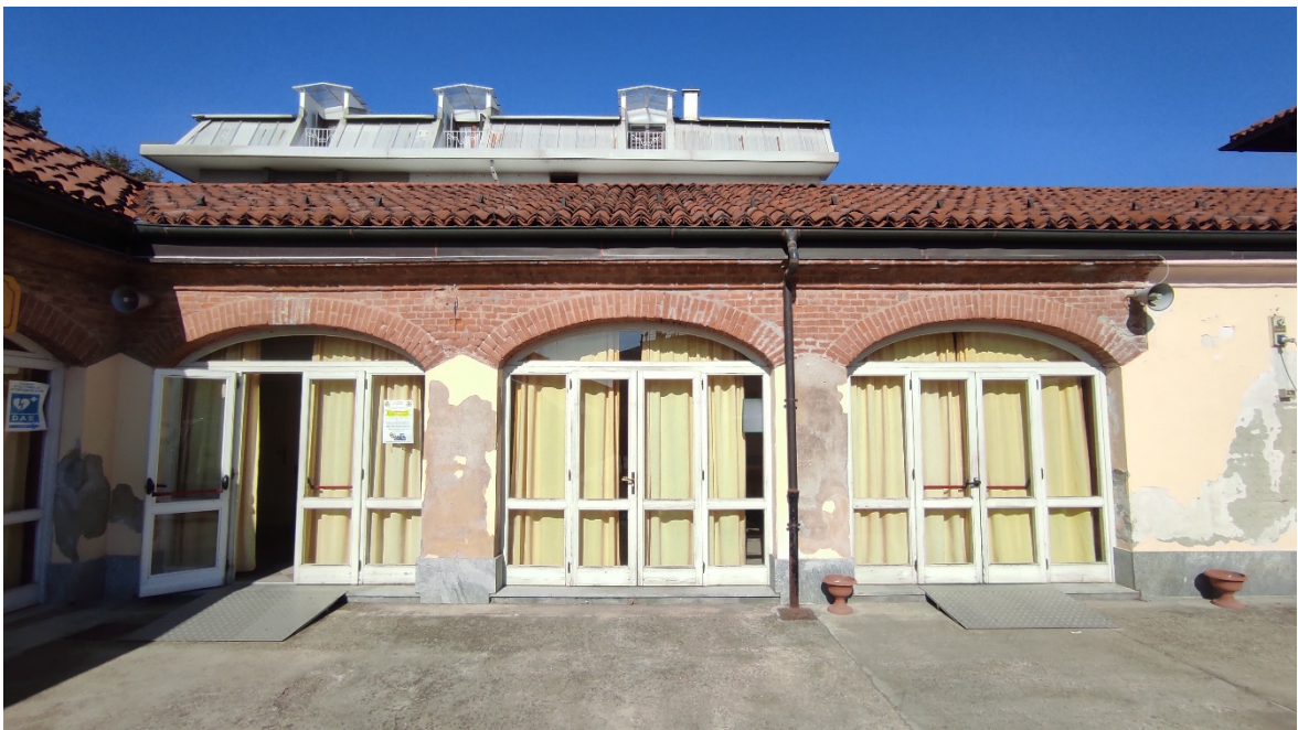
Figura 2 Interno cortile - vista est del basso fabbricato