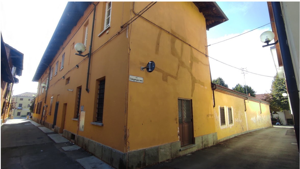
Figura 6 Esterno – vista prospetto ovest via Rezia angolo via Congregazione