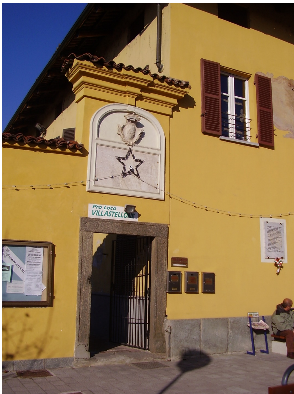
Figura 9 - Esterno – vista prospetto est ingresso pedonale via Gennero