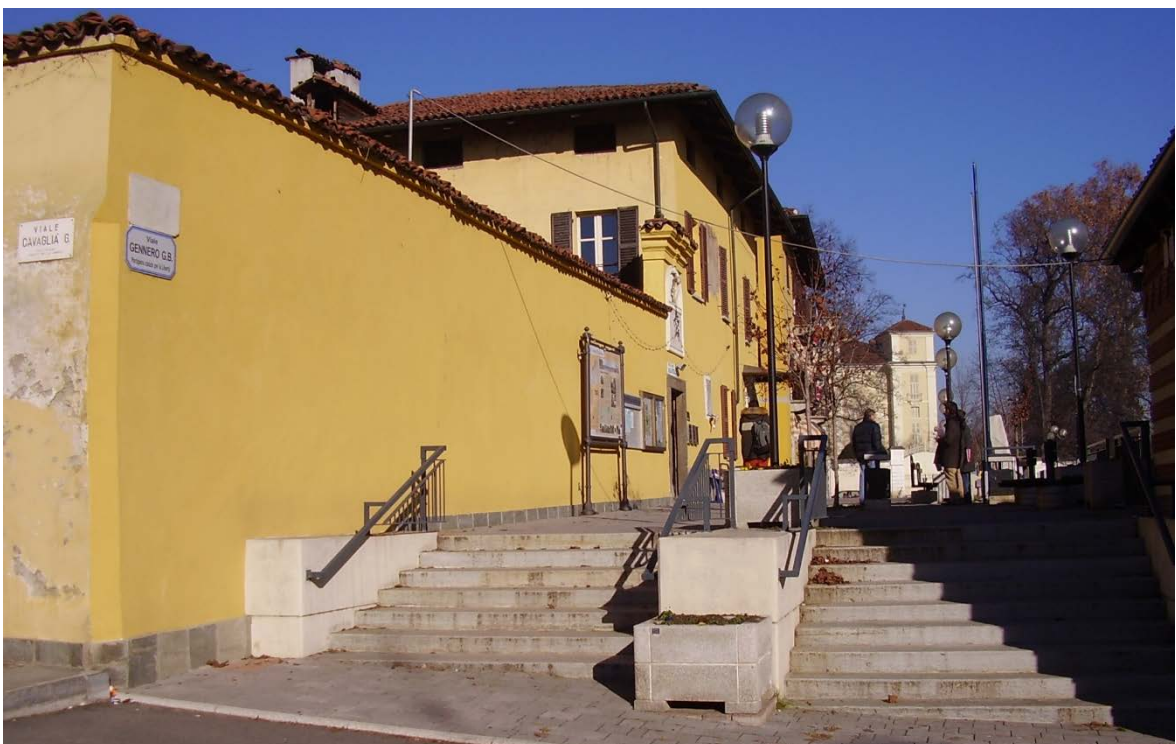
Figura 8 Esterno – vista prospetto sud - est via Gennero