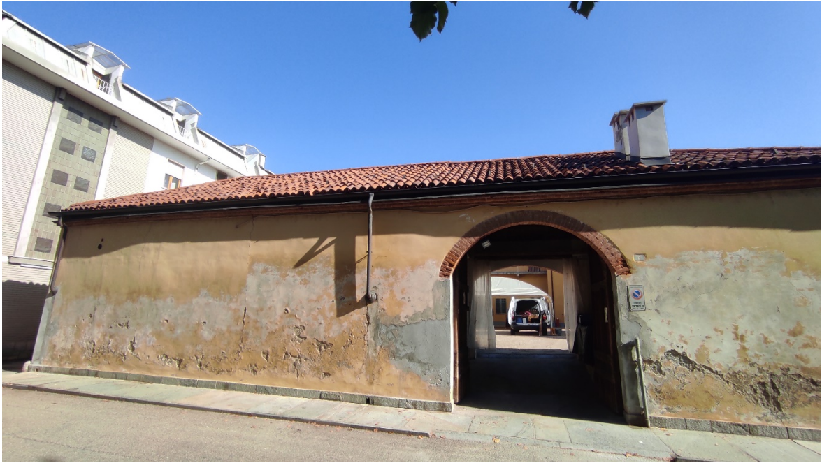
Figura 5 Esterno – vista prospetto sud ingresso carraio via Cavaglià