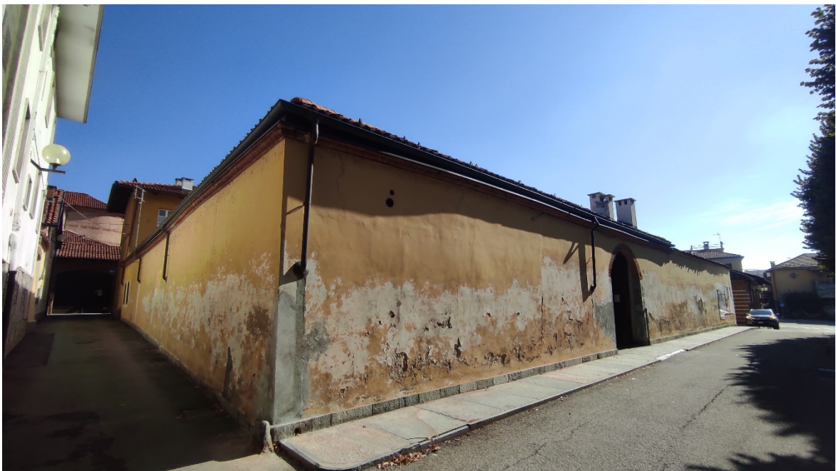
Figura 4 Esterno – vista prospetto sud – ovest via Cavaglià angolo via Congregazione