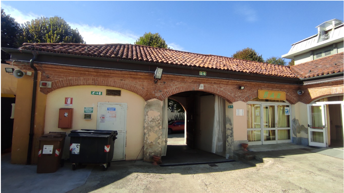
Figura 3 Interno cortile - vista ingresso carraio su via Cavaglià