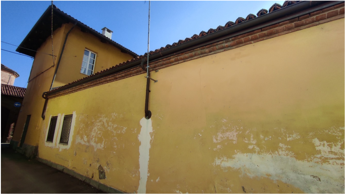
Figura 7 Esterno – vista prospetto ovest via della Congregazione