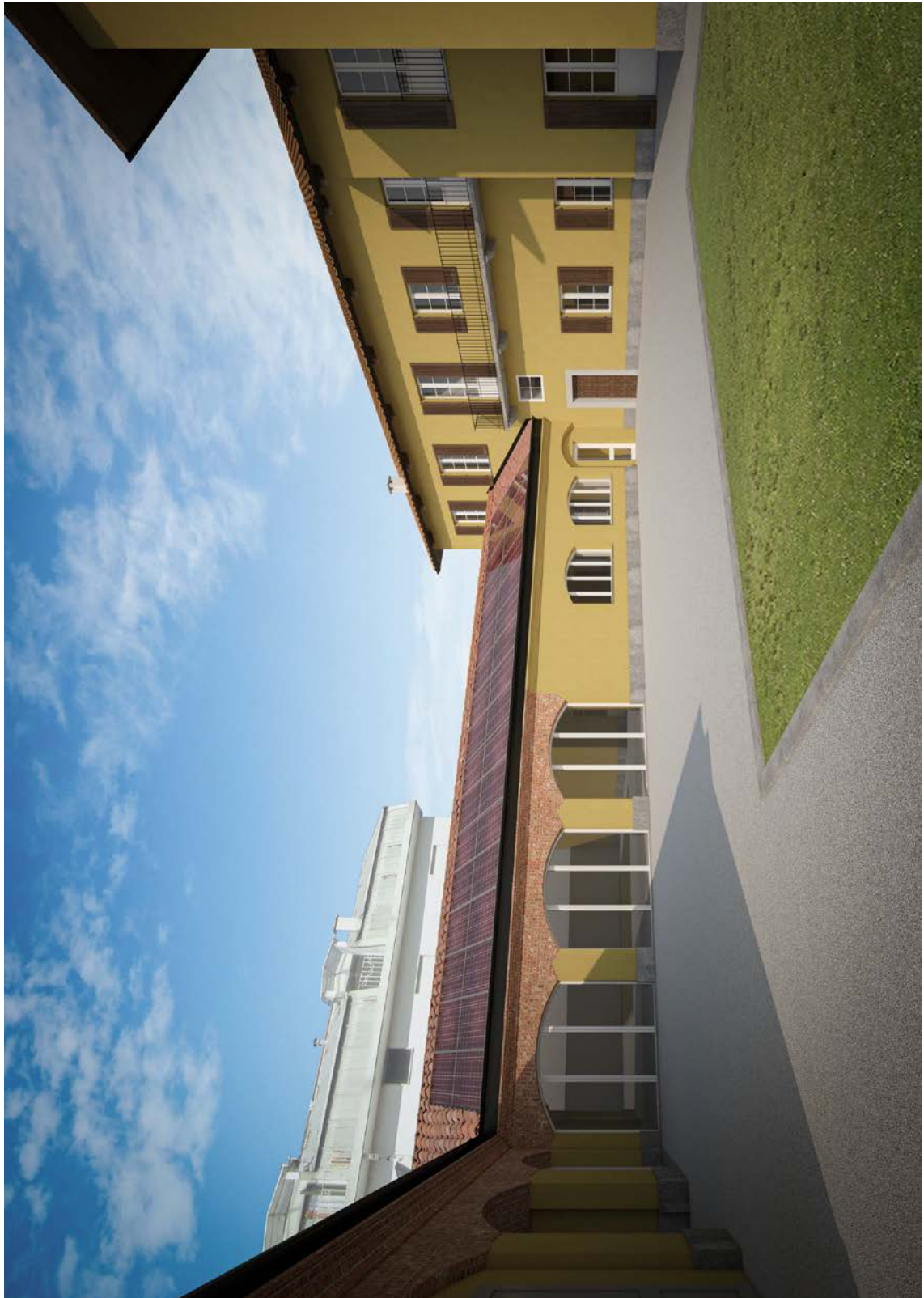
Figura 10 - Fotoinserimento