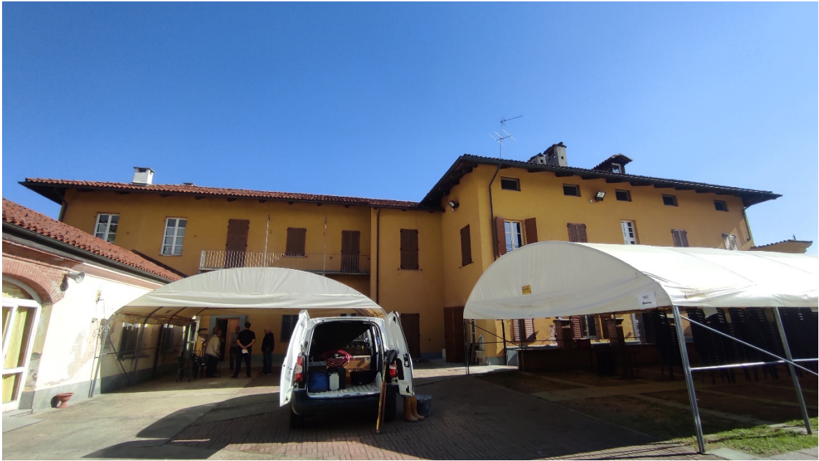
Figura 1 Interno cortile - vista fabbricato principale